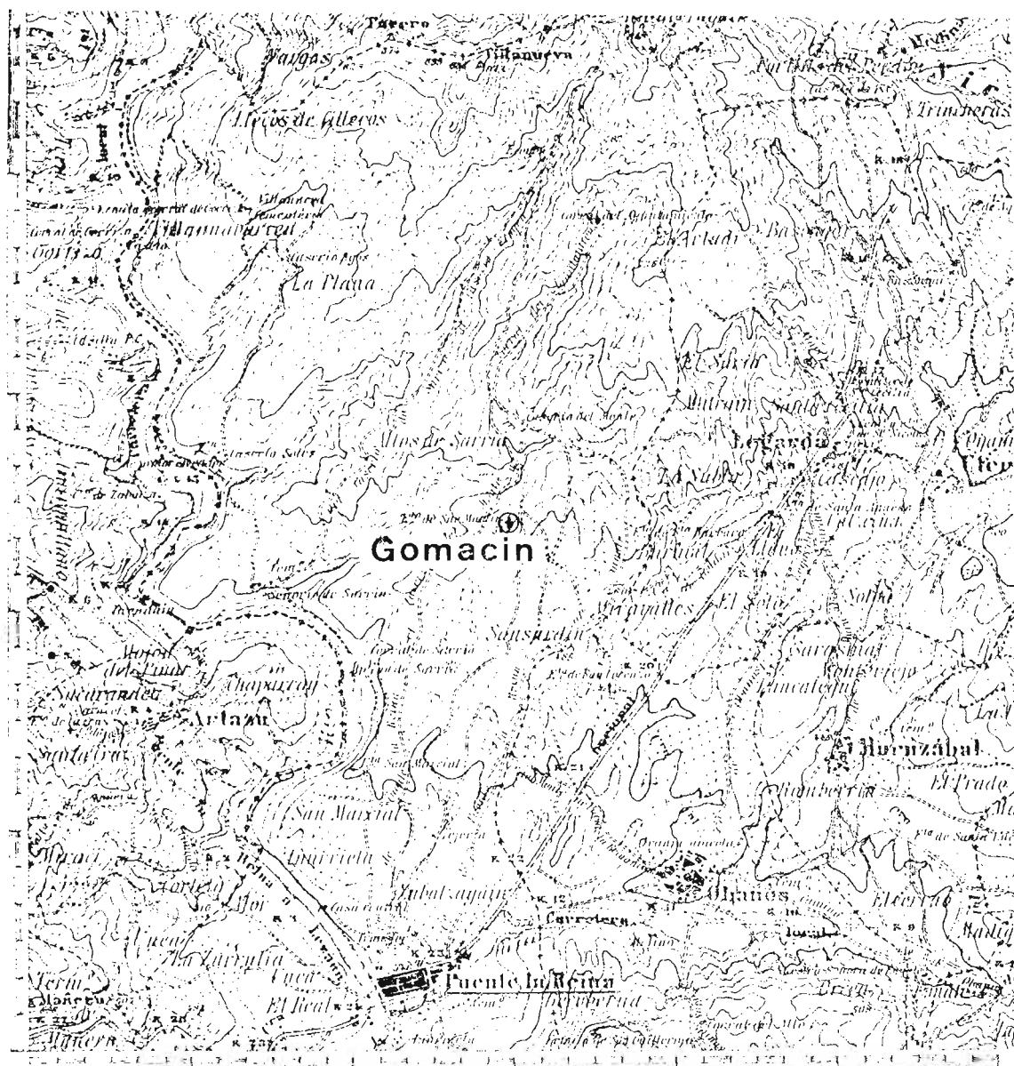
Fig. 2.—Localización geográfica del topónimo Gomacin en el Valdizarbe.