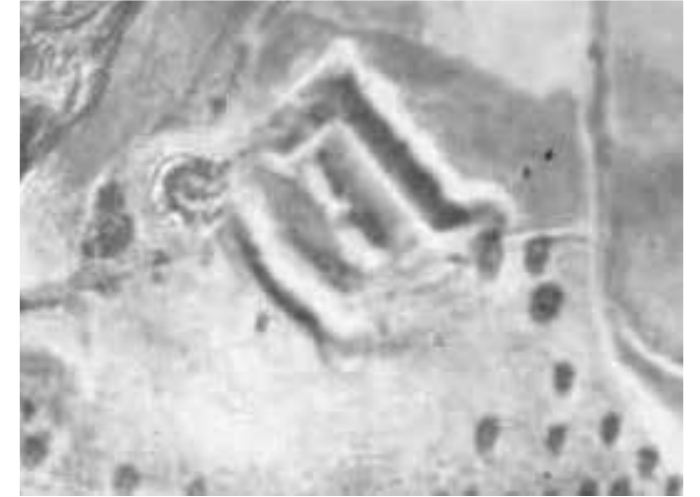
1930 | Foto aérea / Aireko argazkia