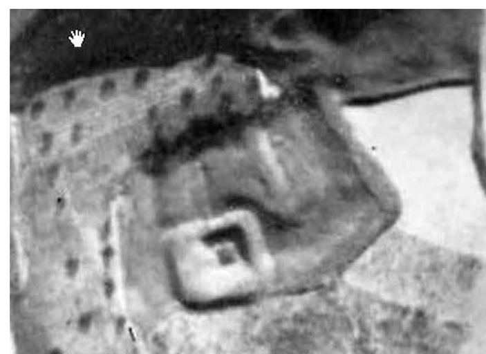
Foto aérea de El Reducto en 1930 Reductoko aireko argazkia 1930ean

PUENTE LA REINA Y SUS FORTIFICACIONES EN EL AÑO 1837 / GARES ETA BERE GOTORLEKUAK 1837AN