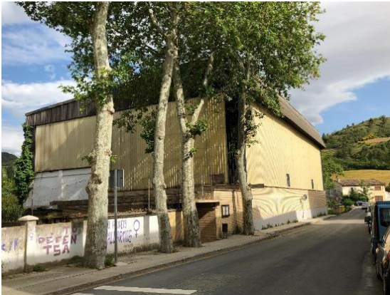
FATXADA ETA KANPOALDEAK